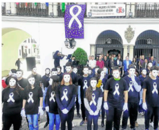
El alumnado de Secundaria representó a todas las mujeres asesinadas hasta la fecha.

Posteriormente tuvo lugar una concentración a las puertas del Ayuntamiento, donde se guardó un minuto de silencio por todas las mujeres asesinadas y donde 45 alumnos y alumnas de Secundaria de los centros escolares de la localidad, caracterizados con unas máscaras blancas y con camisetas con el mensaje Desmascara la violencia de género , representaban a cada una de las mujeres que habían sido asesinadas hasta la fecha.