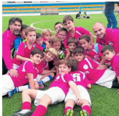
Los prebenjamines posan con el trofeo de campeón.

El fútbol regresará en 2018 al Raúl Carrosa con la reedición de un derbi de rivalidad comarcal que enfrentará al plantel usanenense y al Puebla de Cazalla. La formación moresca, con 4 puntos menos en su casillero a causa de una sanción federativa, es actualmente colista del grupo. ■