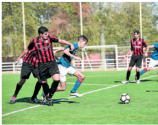
Lance del Triana-Osuna Bote disputado en el Charco de la Pava.

2017 ha sido un año de luces y sombras. En la anterior campaña, los descensos en cascada desde División de Honor originaron el regreso de la formación de Miguel Centeno a la renombrada Primera Provincial. El efecto de la adaptación fue un mito, ya que el bloque de la Sierra Sur, que se sometió en ver-