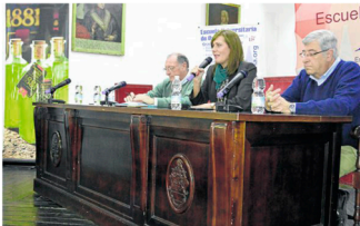
Reunión de la alcaldesa con los socios de la Sociedad Agraria de Transformación SAT Santa Teresa.