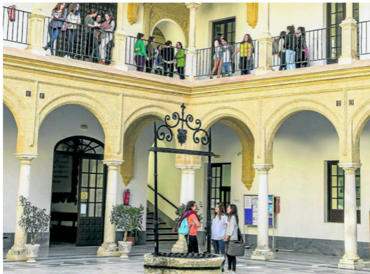
Patio central de la Escuela Universitaria de Osuna.