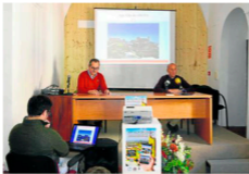
Presentación de la app 'Villa de Osuna'.

El edil de Turismo indicó que la app Villa de Osuna «viene a complementar las dos pantallas Infotactile que en verano fueron instaladas tanto en el Museo de Osuna, donde se ubica la Oficina Municipal de Turismo, como en la Colegiata, unos tótems que, al igual que esta aplicación, disponen de todos los servicios turísticos y comer-