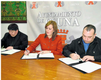
El Ayuntamiento de Osuna y la archidiócesis de Sevilla firman un convenio de colaboración.

Con respecto al horario de apertura de la iglesia de Consolación para poder ser visitada, el párroco de la misma comentó que el horario de invierno será, todos los días de estará a abierta todos los días de cinco a siete de la tarde, excepto los jueves. En verano, se cambiará de siete a nueve de la noche. ■