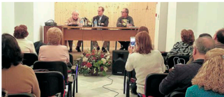
Presentación del libro.