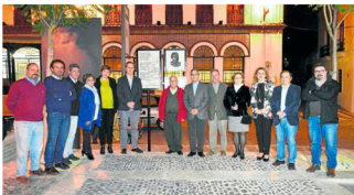
Mural en la Plaza Mayor de Osuna.

El delegado de Cultura resaltó que «al ser un poeta comprometido, la defensa de sus ideales le llevó a un exilio permanente durante la dictadura fran-