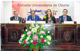
Acto de bienvenida al alumnado de la Escuela Universitaria de Osuna.

Con respecto a este nuevo grado, el rector de la Hispalense manifestó que «avanzamos en el aspecto académico de este centro, creciendo en los dos vectores que definen a la Escuela Universitaria de Osuna, como son la Educación y la Sanidad, por lo que implantar este