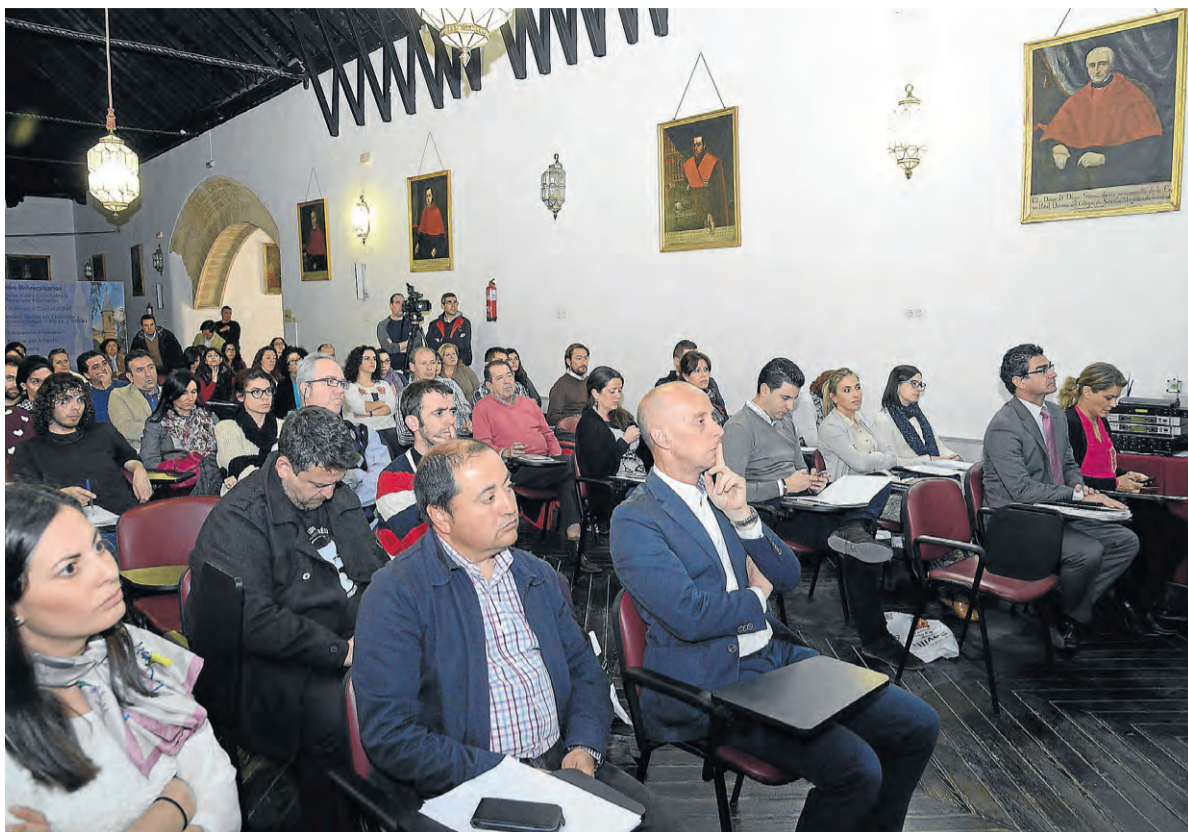
Técnicos municipales y miembros del sector turístico y empresarial recibieron esta formación.

Así, tanto la regidora ursoense como el presidente de la Diputación coincidieron en manifestar su convencimiento de que la promoción para la industria del cine tanto de este municipio como de la