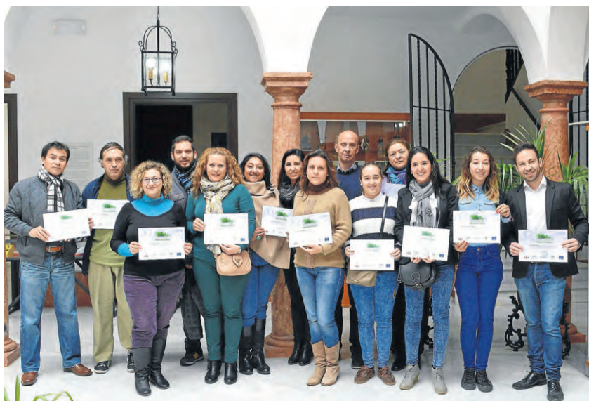
Los alumnos del curso muestran sus diplomas acreditativos.

En el acto de clausura, el delegado municipal de Turismo, Rafael Díaz, ha manifestado que, con la celebración de este curso, con más de un mes de duración, se ha pretendido formar en patrimonio y turismo natural, dada la riqueza medioambiental de la que goza el término ursoense, que aún es una gran desconocida, no sólo para el visitante, sino incluso para los propios vecinos