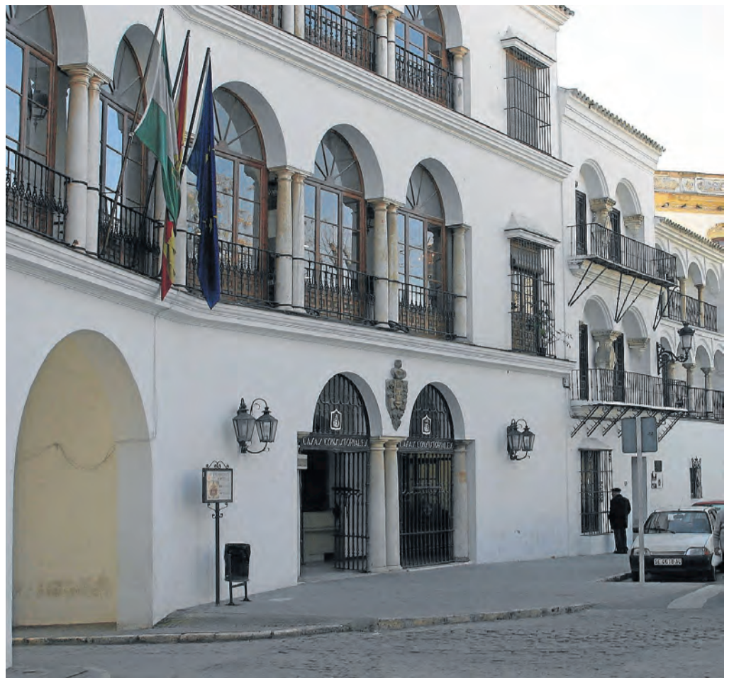
Fachada principal del Ayuntamiento de Osuna. / Gregorio Barrera

que, en estos momentos, existe para sacar adelante un Plan General de Ordenación Urbana, añadiendo que «han sido muy escasos los presentados y aprobados en la provincia de Sevilla, «debido, por una parte, a la situación económica que se atraviesa y que tanto afecta a la construcción, y, por otro lado, a los cambios normativos que exige un PGOU adaptado al máximo a las necesidades del municipio». En este sentido, Andújar invitó a todos los miembros del Pleno a «seguir trabajando conjuntamente en este proceso de confeccionar un PGOU que es viable a la hora de llevarlo a cabo en su futuro», teniendo en cuenta las «limitaciones» de la localidad debido a las grandes extensiones de sus zonas protegidas. ■