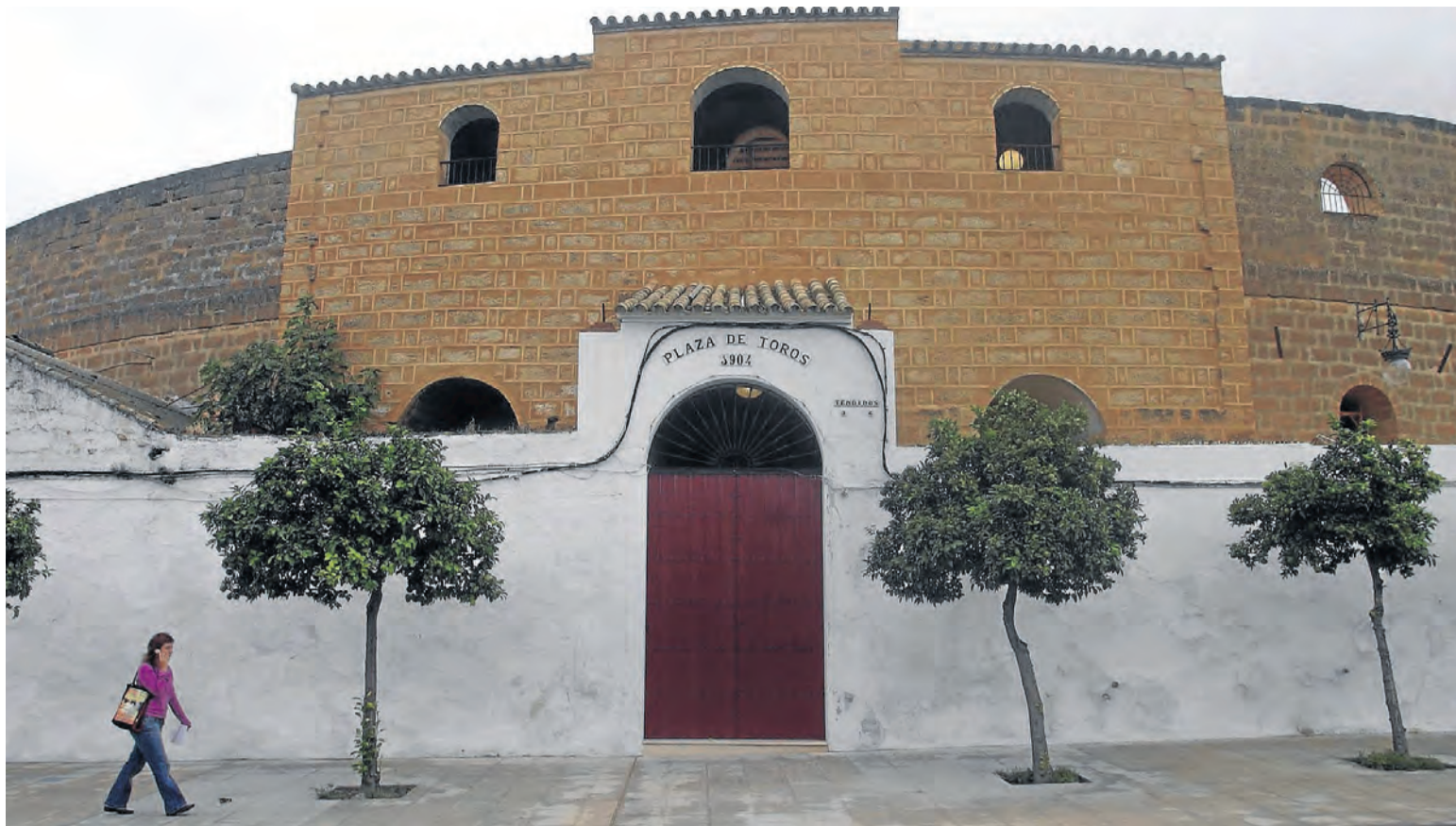
La centenaria plaza de toros de Osuna se reabre como potencial turístico del municipio.