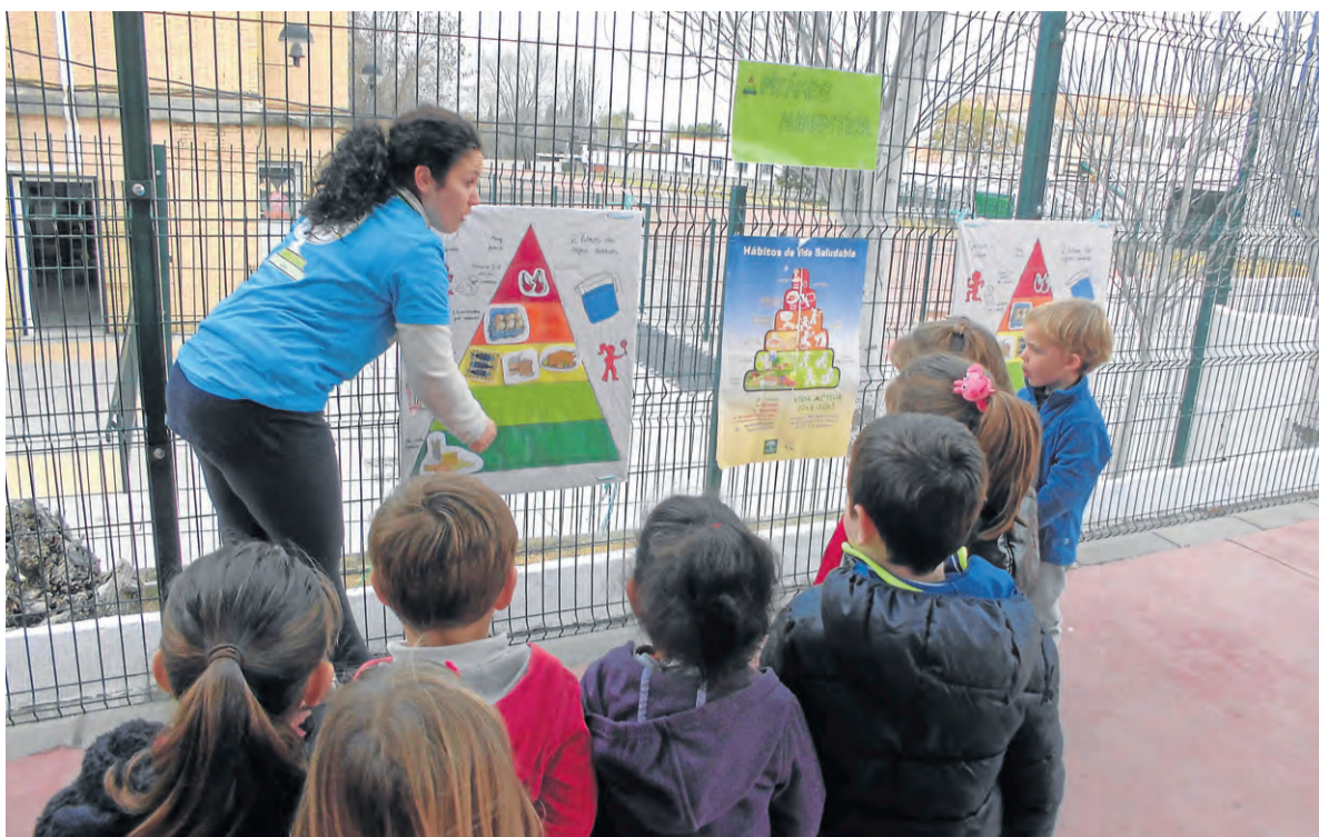
Los más pequeños reciben las claves para mantener una alimentación saludable.

Bautizada como Osuna saludable en el cole , esta campaña no solo hace hincapié en los hábitos, sino que además focaliza parte de las actividades en demostrar la necesidad de consumir frutas y verduras. Los talleres dentro de las aulas se centran en explicarles a los más pequeños qué es la pirámide alimenticia, la importancia de «atrapar» la fruta o la necesidad de comerse una pieza de estas o verduras, pero tam-