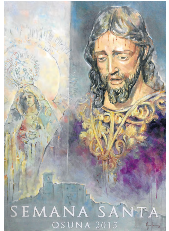
Cartel de la Semana Santa de Osuna de este año.