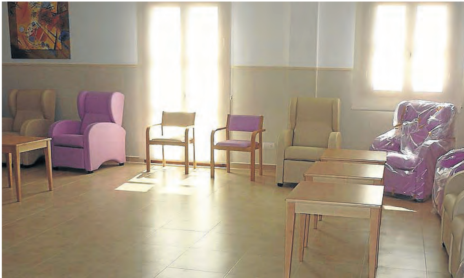
Una de las estancias interiores de la residencia, que ya está equipada para recibir a sus huéspedes.