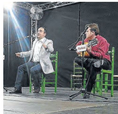
La Pringá se celebró en la Casa de la Cultura.

para optar a la gran final. No obstante, los seleccionados, según rezaban las bases del concurso, no podían «repetir los cantes en la prueba eliminatoria excepto la soleá, que será obligada». El primer clasificado se llevó 600 euros, mientras que el segundo premio está valorado en 300 euros y en 150 el tercero. ■