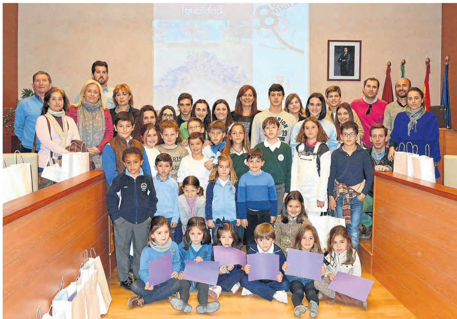
Foto del grupo de los jóvenes que participaron en el Foro Infantil y Juvenil 'Osuna por la Igualdad'.