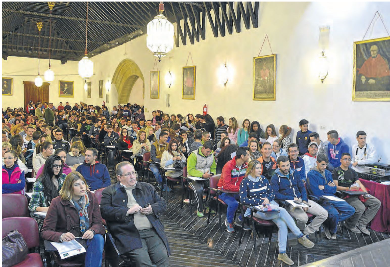
El Paraninfo de la Universidad, abarrotado de jóvenes, acogió la presentación de los planes de empleo de la Junta.

Además, destacó que la mayor rentabilidad de estos programas « es la que obtienen los propios jóvenes al poder acceder a un puesto de trabajo con estas contrataciones », de ahí que, junto con estos planes autonómicos, el Consistorio esté también desarrollando su propio Plan de Empleo Municipal, de ayudas económicas a empresas que contratan a titulados superiores me-