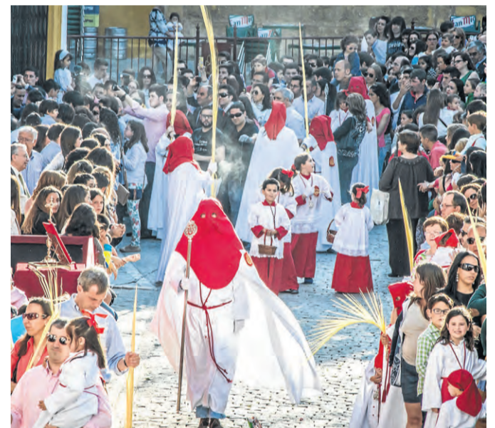
Cortejo de nazarenos del Dulce Nombre.