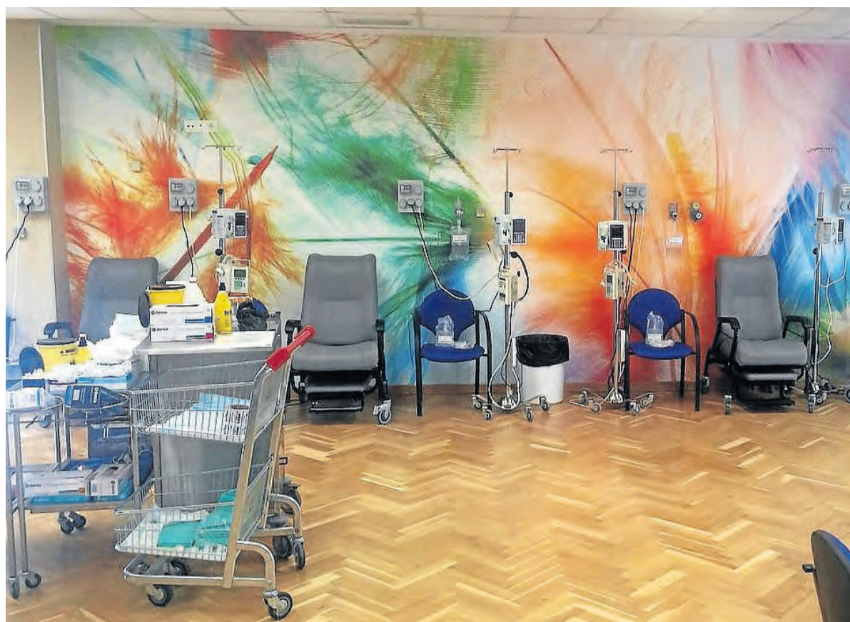
Las nuevas instalaciones buscan la comodidad de los pacientes oncológicos.

En este sentido, las actuaciones han supuesto la redistribución de los espacios e