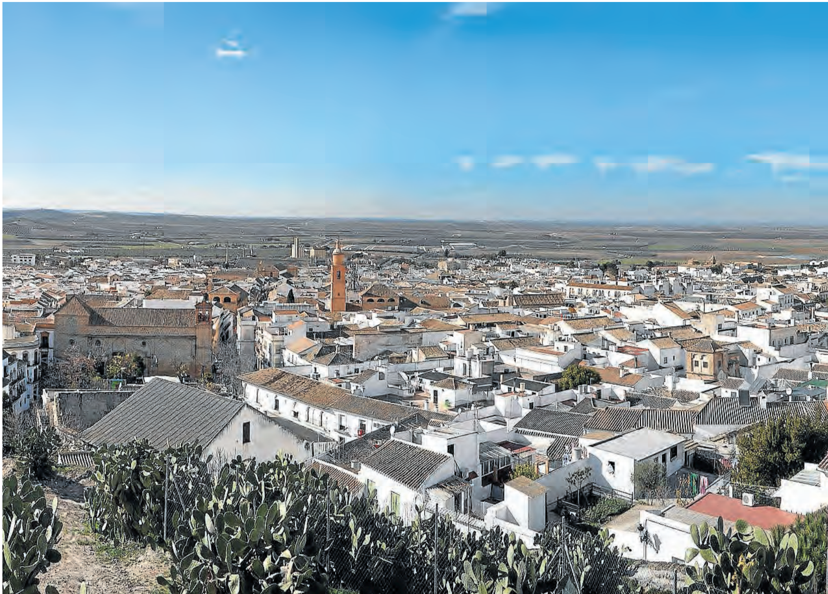
El parque inmobiliario de Osuna se podría ver aumentado en 2.000 viviendas, según se recoge en el Plan General de Ordenación Urbana (PGOU).

No será la única medida en materia de vivienda que contempla el PGOU ursoense, dado que está prevista la regularización de la zona de la calle Alcalá y de Cantera Luisa, con el objetivo de legalizar su situación consolidándose dentro del casco urbano. Es más, dentro de estas viviendas, se contempla la posibilidad de realizar buhardillas, cocheras con anchura de 5 a 6 metros, mientras que se pretende continuar con la rehabilitación de las casas del casco antiguo permitiendo la construcción de patios de mínimo 4 metros de anchura en vez de los 10 metros de la actualidad. Por otro lado, en cuanto a las parcelas construidas en el campo, Jiménez Pinto manifestó que «se van a intentar regularizar el mayor número de viviendas, siempre que cumplan la normativa», dado que existe una ordenanza reguladora para estas edificaciones aisladas