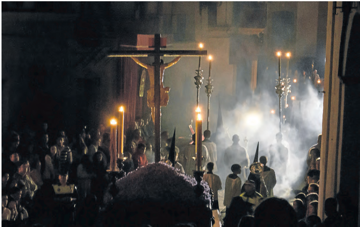
Cristo de la Misericordia, que procesiona la Madrugada del Jueves Santo.