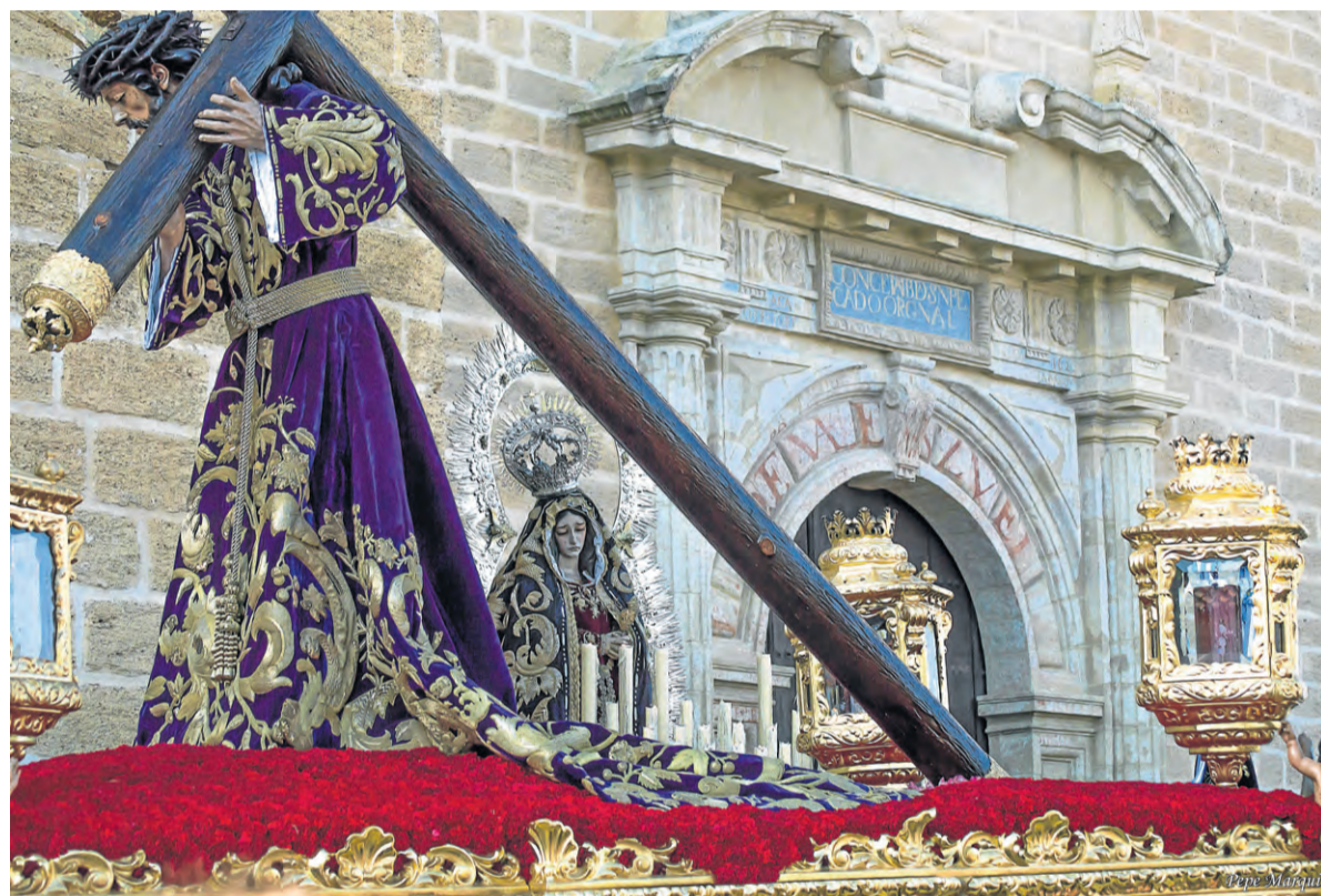
Imagen de Nuestro Padre Jesús Nazareno, que procesiona el Viernes Santo por la mañana.