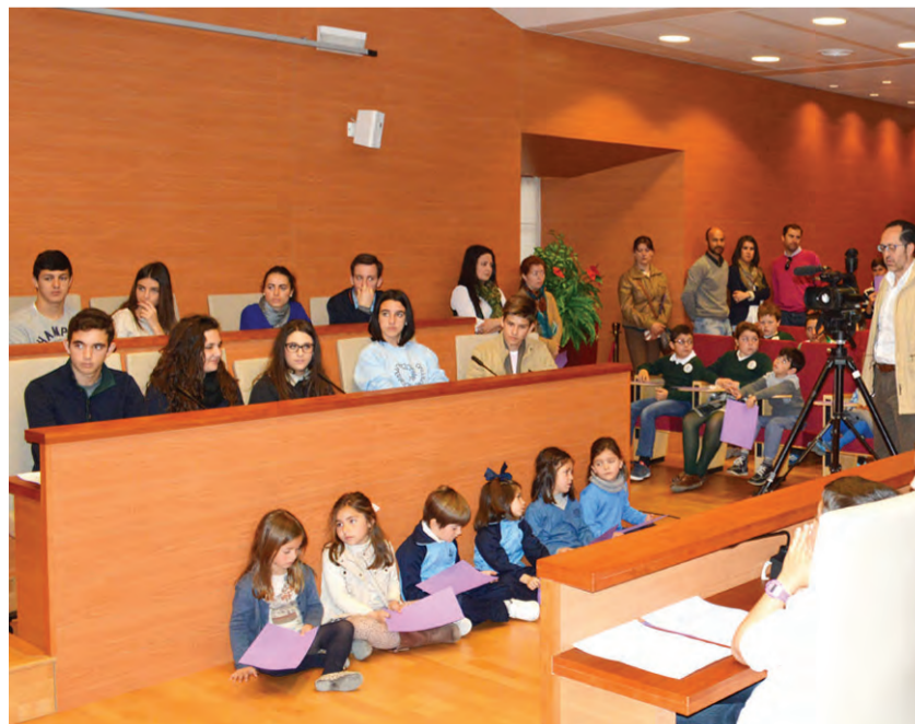
Momento del foro celebrado en el salón de Plenos.

La alcaldesa inauguró el Foro Infantil y Juvenil 'Osuna por la Igualdad' con motivo del Día de la Mujer