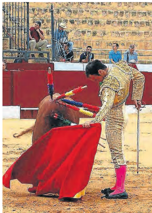
El coso ursaonense será protagonista.

becerradas en clases prácticas el próximo 11 de abril en la localidad sevillana de Espartinas y le seguirán Camas el día 12 de abril, Jerez (Cádiz) el 19 de abril, Sanlúcar de Barrameda (Cádiz) el mismo día, Villaluenga del Rosario (Cádiz) el 3 de mayo y Algar (Cádiz) el 10 de mayo, para dar paso al gran desenlace en la Villa ducal el 15 de mayo. El acto de presentación del evento se celebró recientemente en un hotel de la capital hispalense, y contó con la presencia del consejero de Justicia e Interior, Emilio de Llera, quien destacó que «resulta vital» la labor de las escuelas taurinas para garantizar el futuro de la fiesta nacional por excelencia. ■