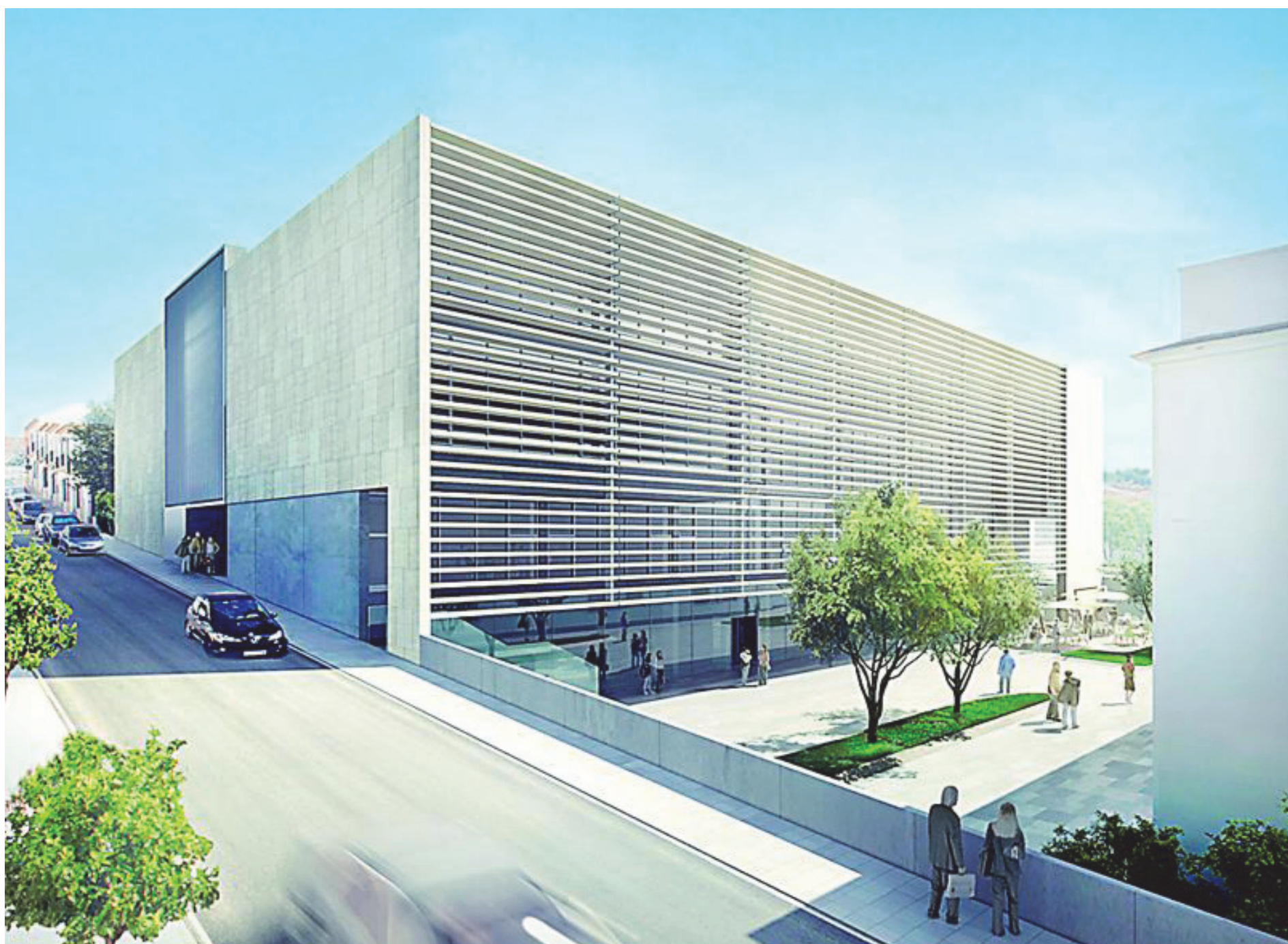
Recreación virtual del edificio que albergará el Centro de Recursos, Aprendizaje e Investigación en el Medio Rural (CREAR). / El Correo