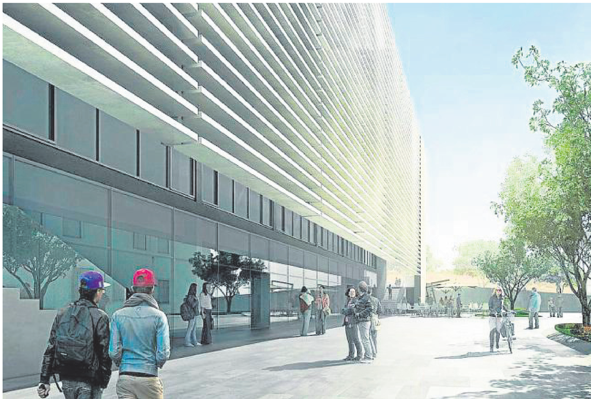
Recreación virtual del diseño que lucirá el nuevo edificio de la Escuela Universitaria de Osuna.