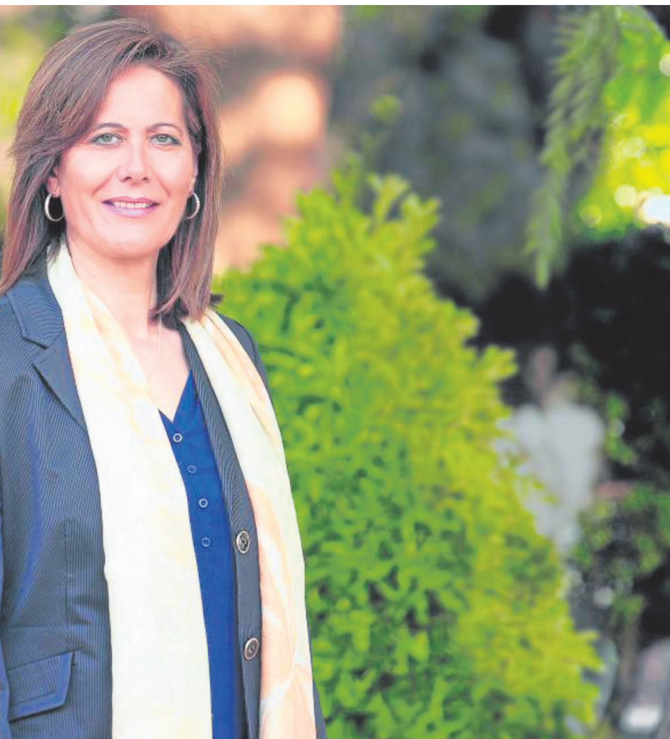
reivindica el papel de su pueblo como cabeza visible de la Sierra Sur.