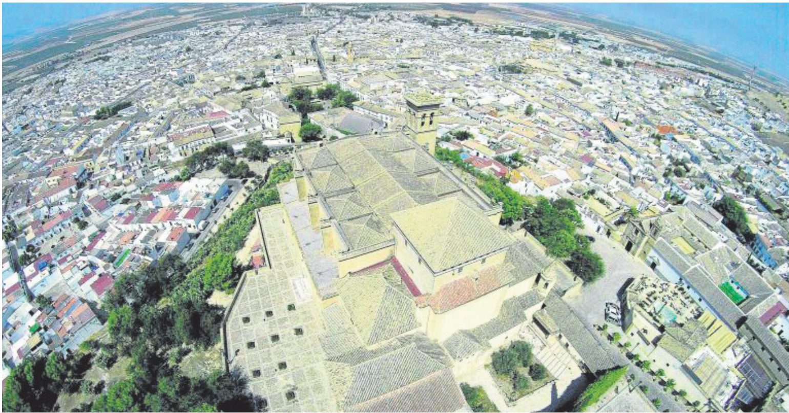
Osuna será de los primeros pueblos en contar con su propia fibra óptica.