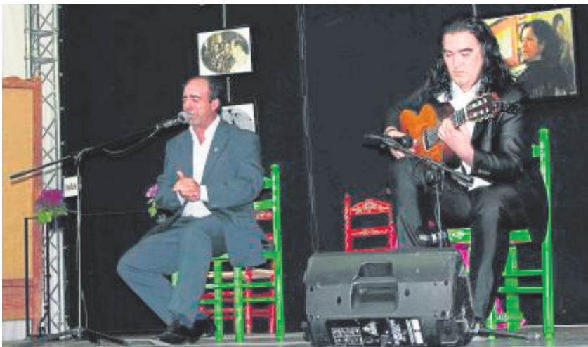
Final de la primera edición del concurso en 2014.

En la primera edición, fueron 20 los artistas que se sometieron al veredicto del jurado. En esta ocasión, el plazo de inscripción se acaba de abrir. Podrá realizarse hasta el 1 de febrero de 2015. Se pueden hacer llegar las solicitudes por correo ( juekypiana15@gmail.com ) o llamando al 661 650 392. Los concursantes serán avisados «con suficiente antelación» para la selección previa. La comisión se reserva, no obstante, el derecho de admisión. Cada concursante tendrá que interpretar un cante por soleá y dos cantes de libre elección. Los clasifica-