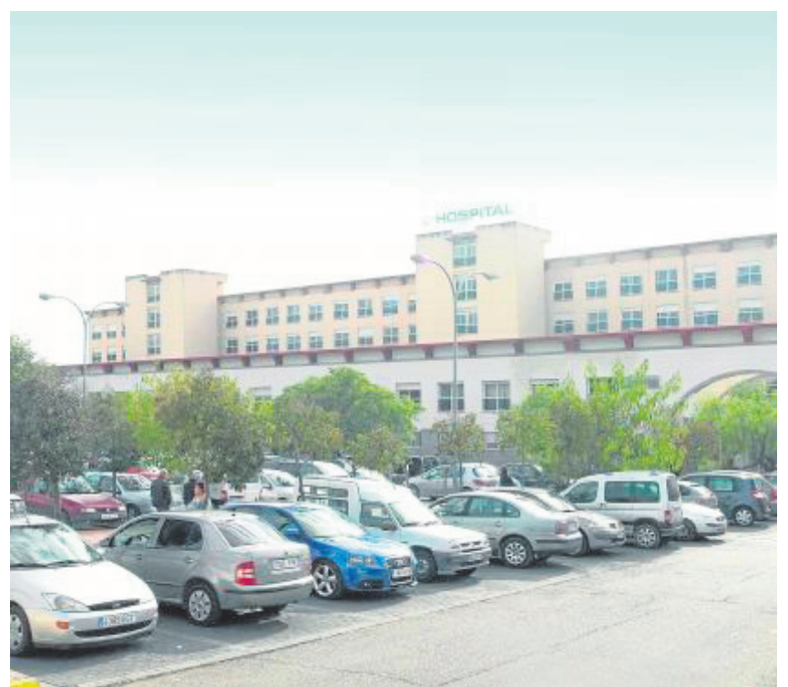
El Hospital Nuestra Señora de la Merced tendrá abastecimiento de Gas Natural.

La instalación de esta línea es en virtud de un acuerdo al que Gas Natural ha llegado tanto con el hospital como con el ayuntamiento. La inversión que la empresa va a hacer para llevar a cabo esta cometida es de 112.250 euros y el plazo de ejecución es de cuatro meses. ■