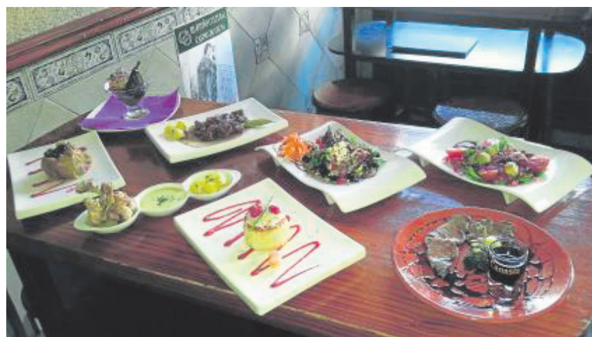
Las tapas temáticas de Casa Curro siguen apareciendo en su carta.