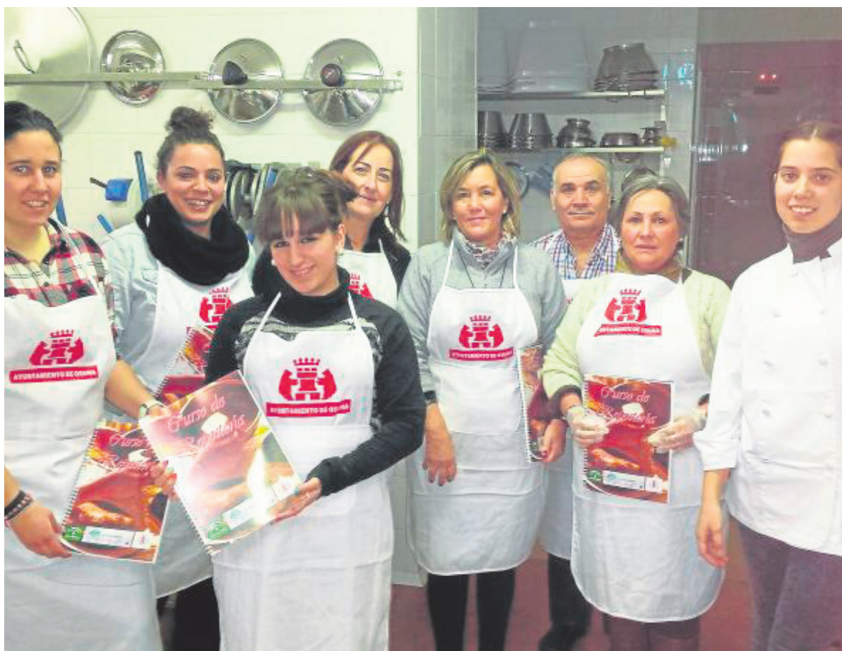
Uno de los grupos del curso, en la cocina del CEIP Rodríguez Marín.

La idea de centrar una formación en la repostería -que parte del Consistorio gracias a la posibilidad que le ha brindado el plan puesto en marcha por la Junta de Andalucía-, ha tenido tal éxito que tan sólo 35 afortunados podrán aprender a elaborar, por ejemplo, las típicas aldeanas ursaonenses -un postre tipo bollo, relleno de crema de huevo y cubierto de azúcar glass- pero, «desafortunada-