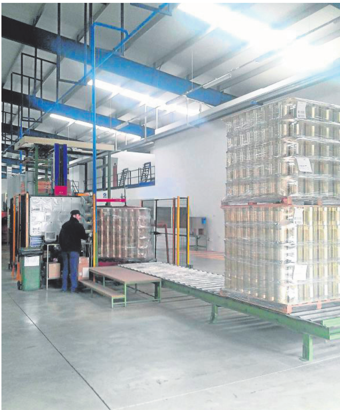
La sede andaluza de la internacional Mivisa se ubica en este polígono ursao-nense.

Desde entonces, la localidad ha aspirado a ser un gran centro logístico, gracias a las mencionadas empresas internacionales que han apostado por ella dada su ubicación estratégica y su completa red de comunicaciones tanto por carretera como ferroviaria. Pero también juegan un papel fundamental en este desarrollo industrial el importante número de pymes -locales y comarcas- que se alojan en Las Vegas, que ofrecen una gran diversidad de actividades industriales y empresariales