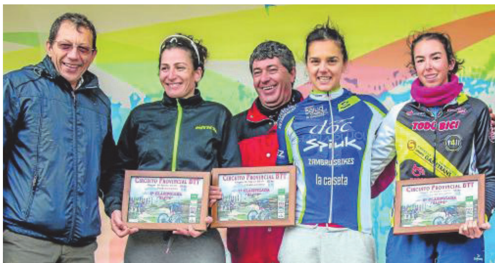
Momento de la entrega de reconocimientos.

Pruebas que están convirtiendo a Osuna en un referente del ciclismo provincial y andaluz en sus distintas modalidades, un hecho que Eslava aprovechó para agradecer a quienes lo han hecho posible. ■