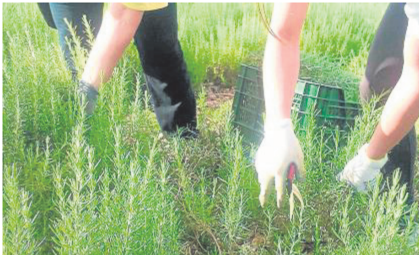
Las Turquillas es pionera en Andalucía en cultivo de plantas aromáticas.

De hecho, desde el Ayuntamiento se está peleando en la actualidad por duplicar el terreno cedido. Y es que, gracias a esta función de la finca, es posible no sólo dar trabajo a jornaleros locales, sino que permite el cultivo de diferentes especies ecológicas que tienen un reconocido tirón en su exportación a nivel nacional e internacional. Es el caso de las 12 hectáreas de trigo duro para la elaboración de pasta ecológica, un producto ya sembrado y en pleno crecimiento que será recogido entre mayo y junio; o de las 13 hectáreas de espárra-