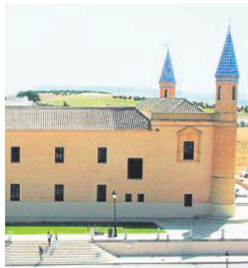
La monumental colegiata.

Precisamente a esa «carácter oficial» de la universidad apela también Moreno Díaz cuando recuerda que «se ha trabajado mucho y se sigue trabajando para conse-