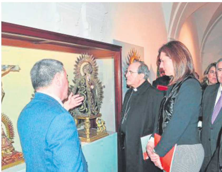
El arzobispo y la alcaldesa visitaron la exposición.

Colegiata. La exposición, en palabras de la regidora, «es inédita, con piezas de gran valor y prácticamente desconocidas por todos al pertenecer a conventos de clausuras o a colecciones privadas».