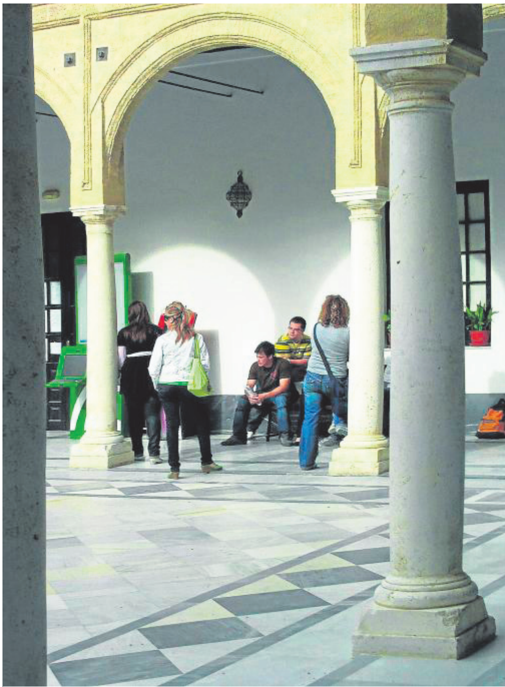
Alumnos en uno de los patios del edificio actual de la Universidad.