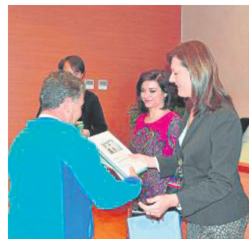
Momento de la entrega de los proyectos.

Osuna, según su regidora, es uno de los municipios más beneficiados por este plan autonómico, en el que la media «es de 10 viviendas por pueblo y aquí han sido 18 las obras de rehabilitación aprobadas» debido al importante casco antiguo e histórico que posee la localidad. ■