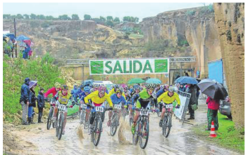
Los ciclistas, en plena acción. / J.A. Buendía