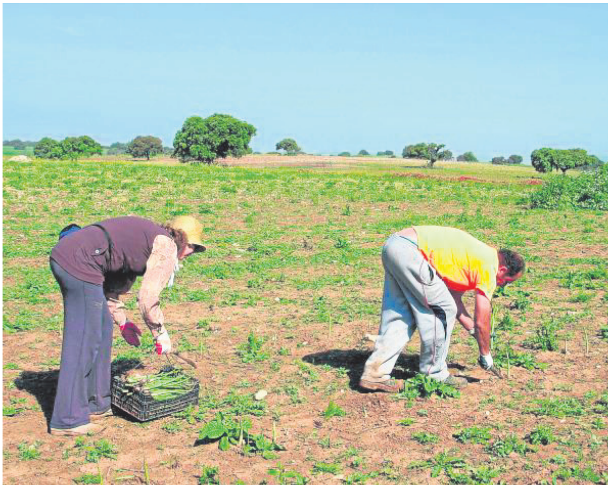
Jornaleros durante la recolección de los cultivos ecológicos que se siembran en Las Turquillas.

No en vano, en la temporada pasada se lograron unos 600 jornales para 50 trabajadores, de ahí que el Ayuntamiento haya renovado recientemente el convenio con el Ministerio pa-