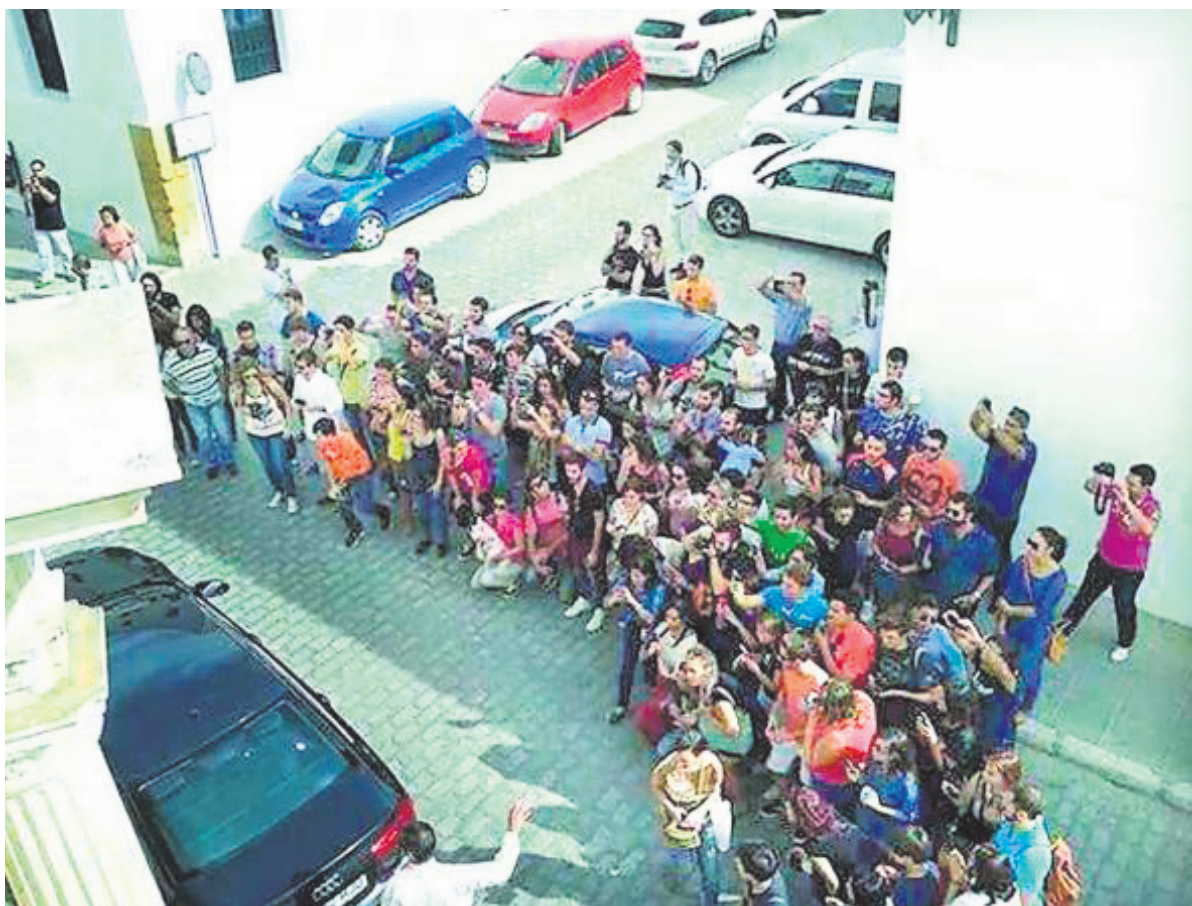
Cientos de fans esperan la salida de los actores a las puertas del hotel Marqués de la Gomera.